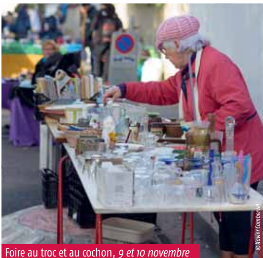
Foire au troc et au cochon, 9 et 10 novembre