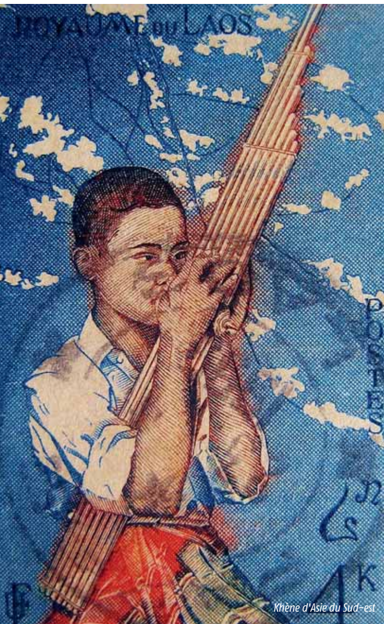
Khèn d'Asie du Sud-est