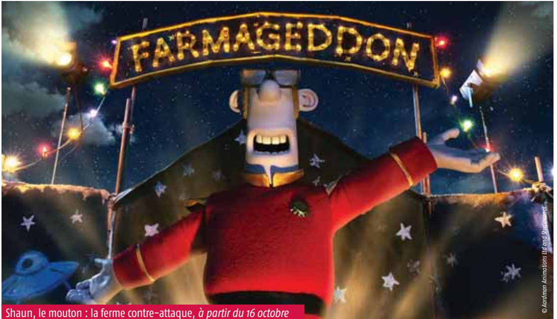
Shaun, le mouton : la ferme contre-attaque, à partir du 16 octobre