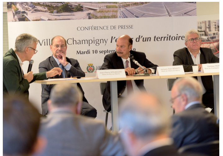
Les maires de Bry, Villiers et Champigny ont tenu une conférence de presse le 10 septembre dernier pour appeler à la mobilisation des habitants afin de trouver le financement du chantier d'interconnexion.

L'ensemble des pétitions sera remis à Elisabeth Borne, Ministre de la transition écologique et solidaire, chargée des Transports.